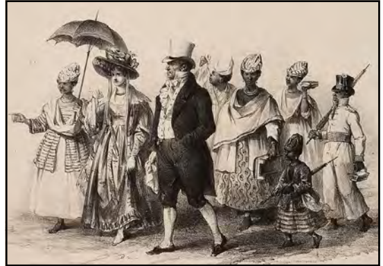
Belangrijke personen die naar de kerk gaan (uit P.J. Benoit, Voyage à Surinam, 1839)

In latere jaren werd ook gesproken van een 'grote schare aanzienlijke vrouwen' die meer glans gaven aan het kinderfeest.